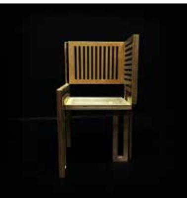
Stol v sliki/Chair in picture (2016)

Avtor: Žan Girandon, Slovenija