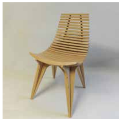
Frame Chair (2015)

Avtorica: Meta Mencinger, Slovenija