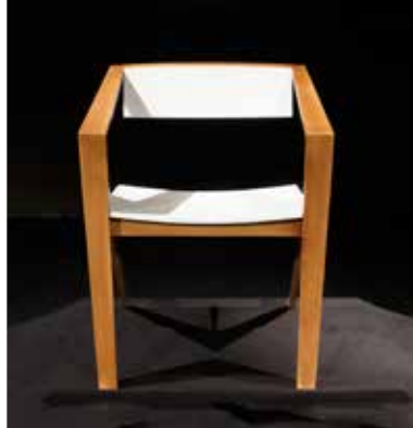
The Arrow chair (2017)

Avtor: Gopalkrishna Pai Kane, Indija