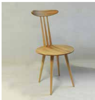
Gozdni sadež (2015)

Avtor: Noel Flannery, Iraska